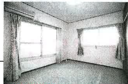
東南の角部屋なので日当たり良好